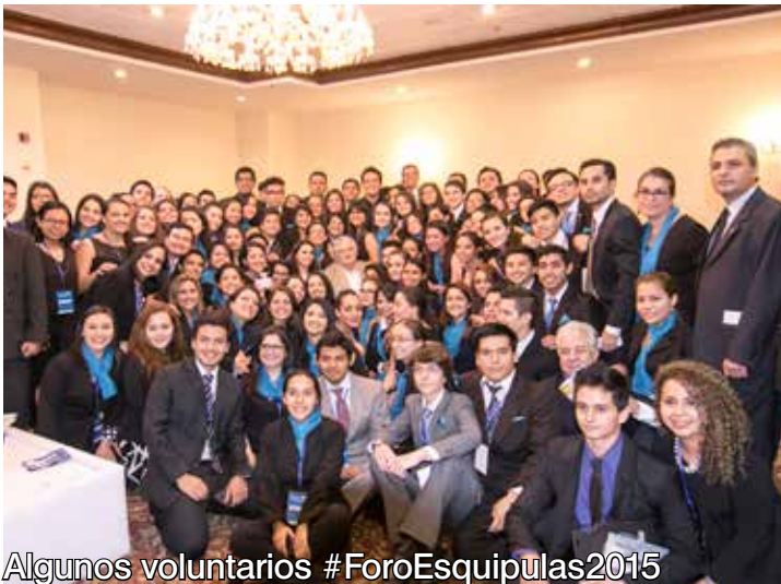
Algunos voluntarios #ForoEsquipulas2015