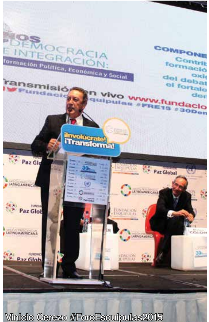
Vinicio Cerezo #ForoEsquipulas2015