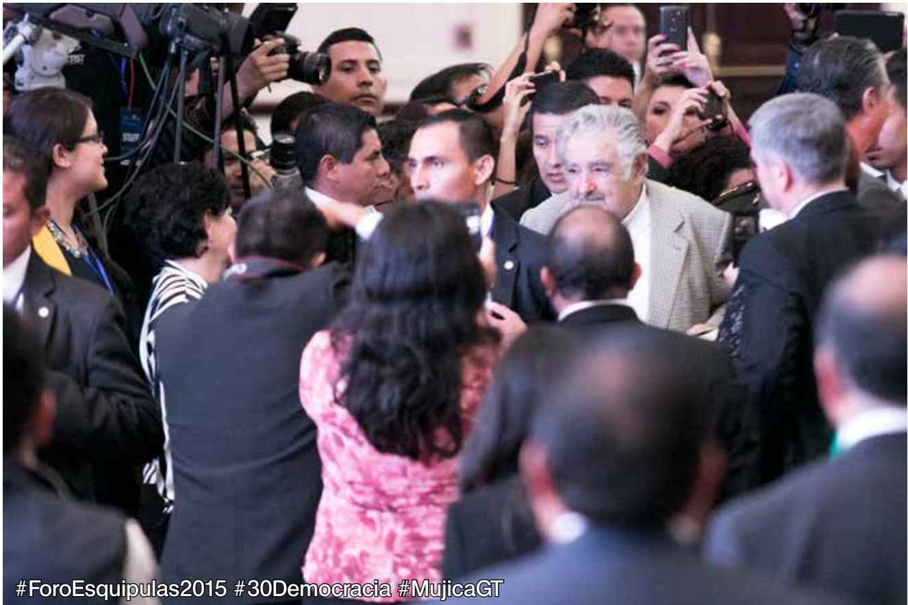
#ForoEsquipulas2015 #30Democracia #MujicaGT