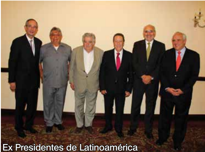
Ex Presidentes de Latinoamérica