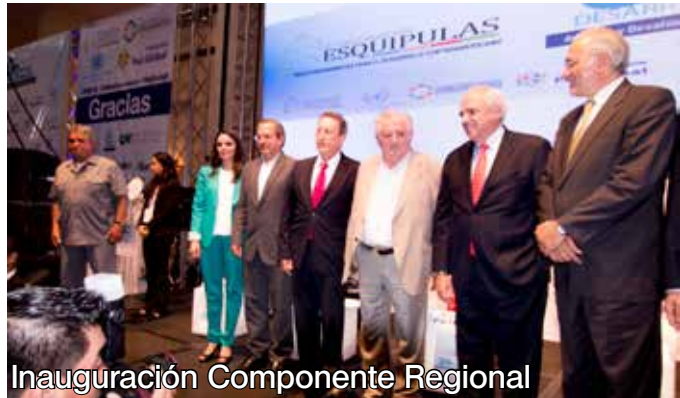
Inauguración Componente Regional